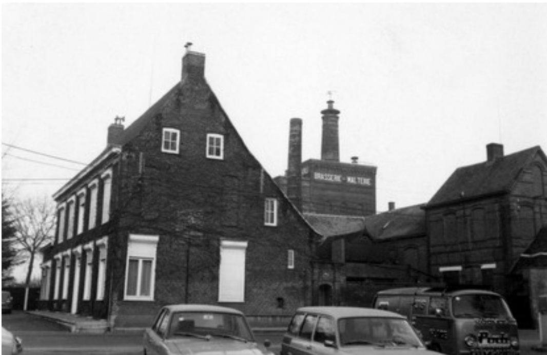
Brouwerij en mouterij het Zwynland circa 1965.

Uitgegeven als Croonestucken XVI in 1993 Digitaal aangeboden 2016