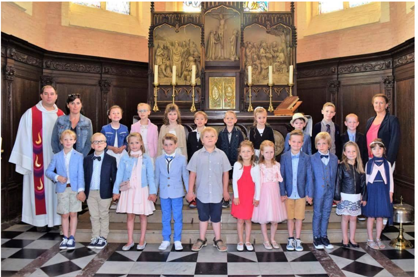
Eerste communie 2017