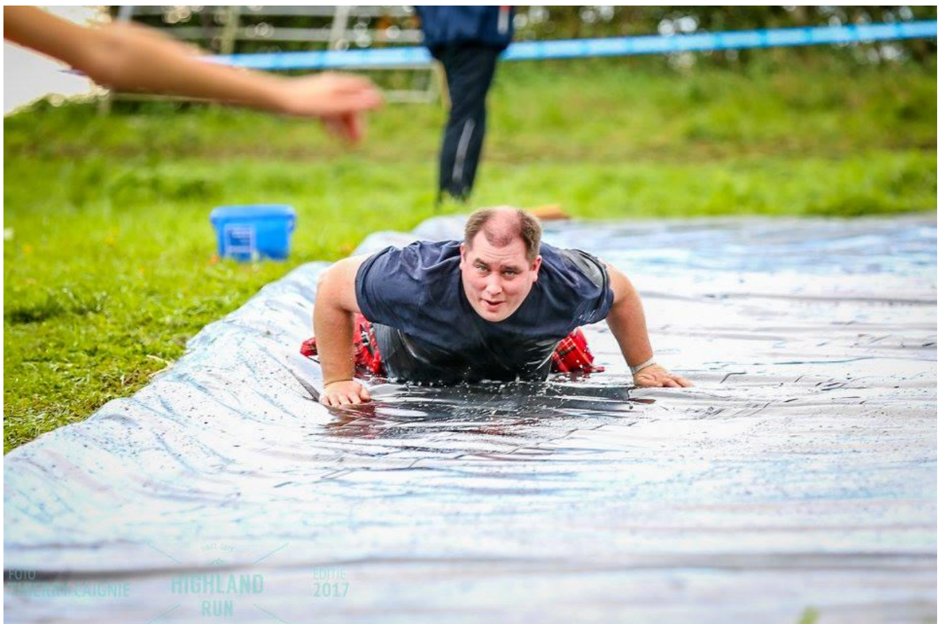
Deelname aan de Highlandrun 2017