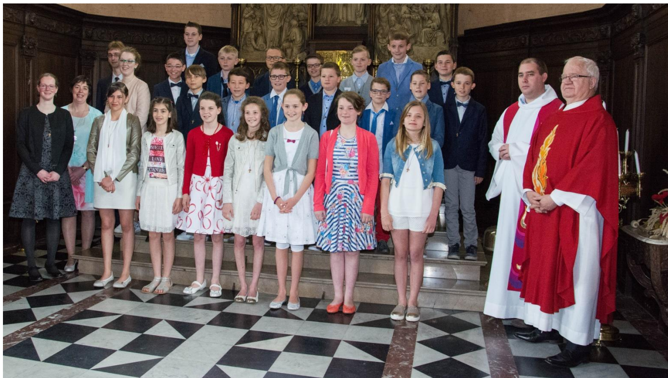
Plechtige communie 2016