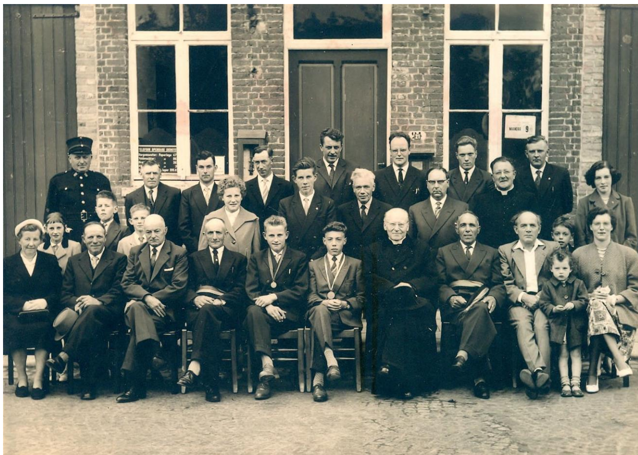
Huldiging van 2 laureaten +/- 1958

† Barmhartige God, wees mij genadig en liefde te aanvaarden in 't hemels Vaderhuis