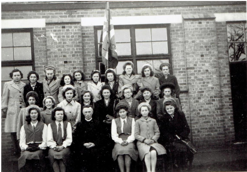
2 bijna identiek foto's let op het meisje in het deurgat