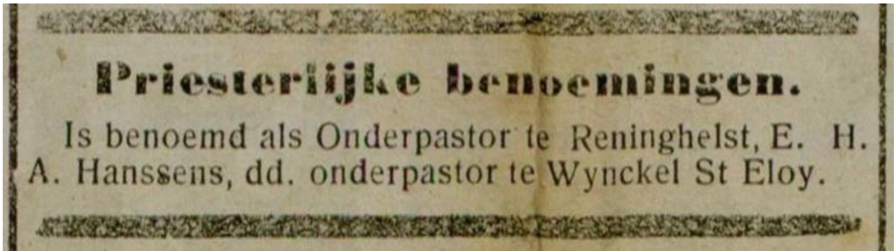
De Poperingenaar, 14 september 1919, p.2

onderpastoor Parochie Sint-Vedastus, Reningelst. 5 september 1919 - 25 februari 1936