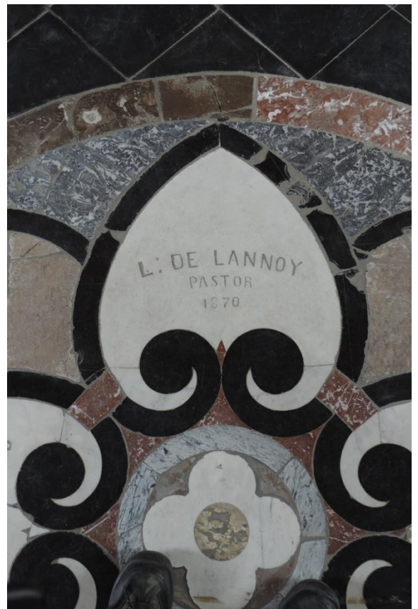
Vloersteen in de kerk van Reningelst